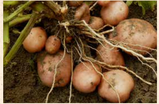
Germany, 2023, private Farm