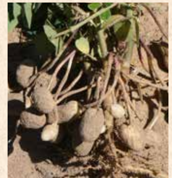
Senegal, Peanuts, ISRA